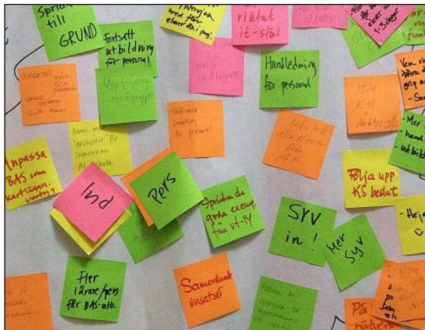
Förslag på aktiviteter för framtiden