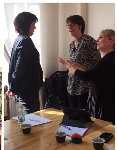
Bilder från utvecklingsgruppsmöte för indikatorerna den 20 april