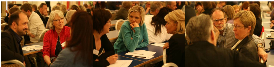
"Ett systemiskt möte är som en exkursion"