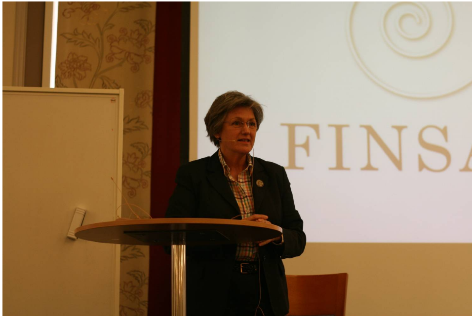
Christina Husmark-Persson, socialförsäkringsminister

Christina Husmark-Persson inleder med att berätta om bakgrunden till förändringen i rehabiliteringskedjan som i stort bygger på Anna Hedborgs rapport där sjukskrivning beskrivs som en ”parkeringsplats”. Husmark-Persson tror att de omdebatterade tidsgränserna är en garant för att människor inte ska glömmas bort utan att olika myndigheter och aktörer faktiskt måste agera, inte ”vänta och se”.