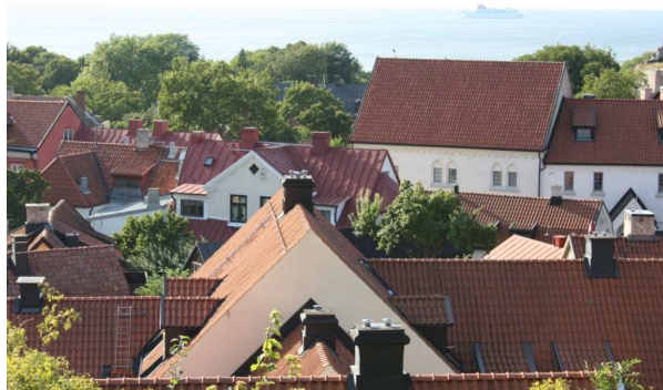
NNS styr mot Gotland i sommar!

NNS ändamål är att vara språkrör för samt stödja och utveckla samordningsförbund.