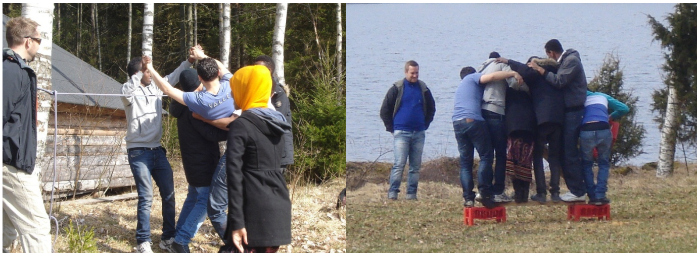
Två av samarbetsövningarna ungdomarna fick pröva på

och den 11/9 kom svar från polisen på skrivelsen, (se bilaga 3), att det planeras att bilda en ny ungdomsgrupp som ska arbeta mot unga lagöverträdare upp till 18 år.