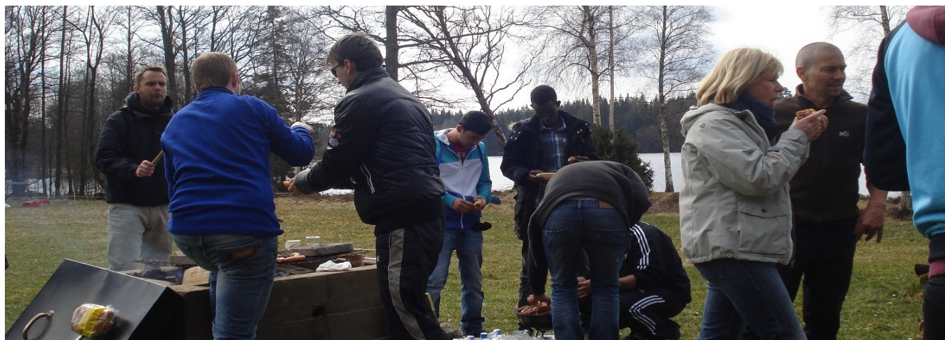
Lunchrast i Tolg

Planeringen av ledarskapsutbildningen påbörjades i januari 2012. Medverkande på de inledande mötena var berörda tjänstemän från ungdomskontoret och 11-gården. Beslut togs om innehåll och syfte med utbildningen, vem som ansvarade för vad, att ungdomarna skulle ansöka till utbildningen genom att fylla i ansökningsformulär, (se bilaga 1), samt genomgång av vilka ungdomar som skulle vara aktuella att delta i utbildningen. För ungdomarna med nystartsjobb var det obligatoriskt att gå utbildningen. Andra ungdomar motiverades och handplockades utifrån att de redan arbetade extra i verksamheterna Unic, Musikhuset och Pax. För andra ungdomar var utbildningen frivillig med hopp för oss att hitta bra förebilder att ta in i ungdomsverksamheten längre fram. Sammanlagt var det 43 ungdomar, i åldern 17-28 år, som ansökte till utbildningen och efter gemensamt beslut i arbetsgruppen fick alla som ansökt möjlighet att gå utbildningen.