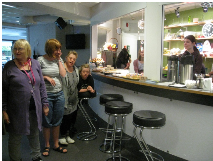
Fikapaus på Pax

Projektet var uppdelat på två perioder, första perioden var vecka 25-27 och andra perioden var vecka 31-33. Båda perioderna var snarlika i planeringen och grundsyftet med sommarjobbet var att öka tjejernas självkänsla och den egna identiteten, utgå från aktiviteter de själva ville göra, förbättra delaktigheten i samhället och ge samhällsinformation, medvetandegöra den egna förmåga samt prata om förebyggande insatser mot stress. Den först perioden arbetade sju tjejer i åldern 16-19 år och i den andra perioden arbetade åtta tjejer i åldern 16-20 år.