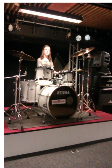
Livskvalite' på Musikhuset

Tjejernas problematik har varit allt från isolering i hemmet, skolvägran, familjeproblematik, självskadebeteende, till önskan om vänner, träning, kärleksproblem och svårigheter som uppstår för tjejer i kulturkrocken av att komma till ett nytt land. Många av problemen har sin grund i familjerelationerna men det är även där lösningarna finns. Föräldrar har kämpat länge för att stötta och hjälpa sina barn utan att känna att det lett till någon förändring. Detta har resulterat i känsla hos föräldrarna av uppgivenhet, maktlöshet, men också ilska. Även barnen speglar föräldrarnas känslor. Att öppet, ärligt och rakt få prata om svårigheter har många gånger verkat befriande och lett till nya infallsvinklar att jobba efter, för att försöka lösa problemen. En del av problemen i livssituationen har även haft sin grund i olika diagnoser som autism och borderline, där tjejerna har behov av att jobba med självkänedom och hitta strategier för att öka sin livskvalité.