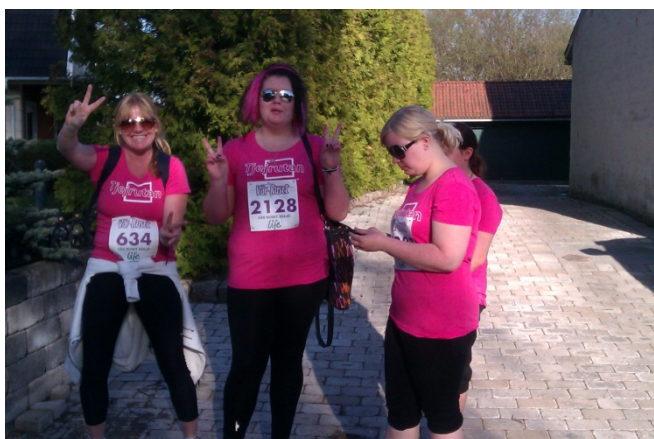
Se så snygga vi är!

Den 3 maj 2012 var Tjejrutan med och sprang vårruset. Sex tjejer var anmälda i laget men p g a sjukdom hos en tjej var vi fem som genomförde loppet. Fler tjejer bjöds in med avböjde att delta av olika skäl, bl.a. avvisning från landet. Till detta arrangemang trycktes det upp jättefina T-shirtar med loggan på och tillsammans med alla andra tjejer som var med i vårruset var vi de snyggaste tjejerna runt Växjö sjön. Kvällen började med lite stänk och pust från tjejerna att genomföra loppet men vid picknickkorgen efteråt kände vi oss nöjda och hade så mysigt tillsammans. Mitt förslag att delta i Tjejmilen i Stockholm till hösten röstades ner.